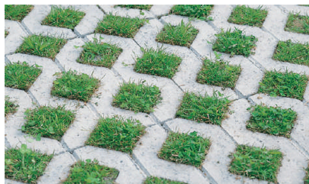
Système alvéolaire avec végétation

Tout espace de stationnement, ainsi que toute allée d'accès, doivent être pavées ou autrement recouvertes avec les matériaux autorisés, de manière à éliminer tout soulèvement de poussière et empêcher la formation de boue, et ce, au plus tard 6 mois après la fin des travaux d'excavage, ou la fin des travaux de construction d'un bâtiment principal.