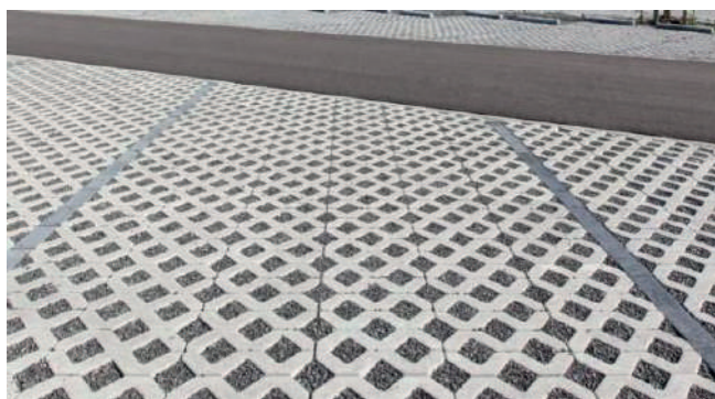
Système alvéolaire avec gravier

Dans tous les cas, le revêtement doit empêcher tout soulèvement de poussière ainsi que la formation de boue.